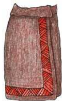
Wrap Around Skirt